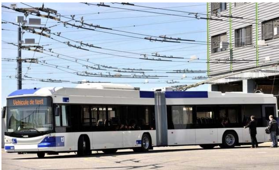
Ein Testfahrzeug der Firma Hess.

Beim Familienbetrieb Hess in Bellach SO herrscht Hochbetrieb: Der Trend zu grossen, umweltfreundlichen Transportmitteln im städtischen Raum beschert dem Busersteller einen Auftragsboom.