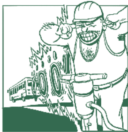
So tönt der Gasbus. Der Trolleybus ist viel leiser als der Gasbus. Machen Sie jetzt den Hörtest auf www.protrolleybus.ch !