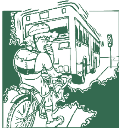
So stinkt der Gasbus. Der Trolleybus produziert keine Abgase! Velofahrende wissen das zu schätzen.