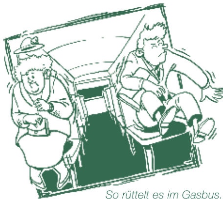
So rüttelt es im Gasbus. Der Trolleybus fährt entschieden sanfter. Achten Sie sich mal darauf!

Kein Gestank und kein CO 2 – darum: Ja zur Trolleybus-Initiative!